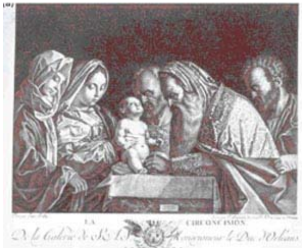
Circuncisión a un infante realizada por un Mohel con la uña de su dedo. Abajo vemos cuchillas antiguas de circuncisión. Plato y Torah (300 d.c)

El libro de Josué dice que los Judíos fueron circuncidados en el desierto, sin embargo se consiguen estudios que reflejan que no hubo circuncisiones durante la travesía e inmediatamente antes de entrar a la Tierra prometida circuncidaron a sus varones.