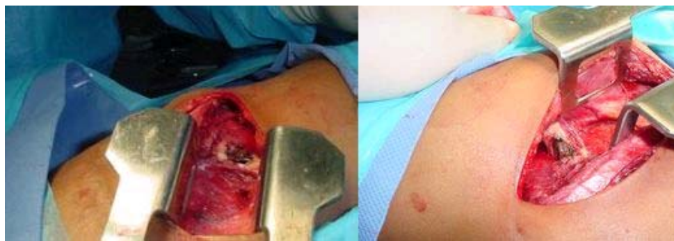
A B Figura 4: A Toracotomía posterolateral derecha, con atelectasia parcial del LID, con múltiples adherencias fibrosas de éste al diafragma y a la pared torácica. B Presencia de un cuerpo extraño intraparenquimatoso de origen vegetal (pedazo de madera).

El tratamiento quirúrgico consistió en la segmentectomía inferior derecha debido a que el resto del parénquima como el bronquio fuente se hallaban sin alteraciones estructurales (figura 5a y 5b).