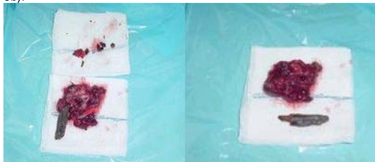
A B Figura 5: A. Segmento pulmonar del lóbulo inferior derecho con zona rojo-violácea indurada, de 4x3 cm, con una cámara donde estaba alojado el CE. B. Cuerpo extraño intraparenquimatoso de origen vegetal (pedazo de madera).

El tratamiento quirúrgico consistió en la segmentectomía inferior derecha debido a que el resto del parénquima como el bronquio fuente se hallaban sin alteraciones estructurales (figura 5a y 5b).