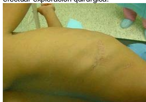
Figura 3 Cicatriz postraumática en hemitórax derecho a nivel del 6 espacio intercostal

En el ingreso se constató un niño en buenas condiciones clínicas, con un examen pulmonar dentro de límites normales. El resto del examen físico no reveló otros hallazgos patológicos. Los estudios de laboratorio, solo mostraron un hematocrito que varió de 30 a 24% en tres meses (desde octubre 2005 a enero de 2006). La broncoscopia efectuada, mostró una zona de inflamación y congestión de la mucosa de los bronquios basales derecho, sin signos de sangrado activo y sin la observación de un cuerpo extraño en la vía aérea bronquial. Ante la evidencia radiológica de un proceso pulmonar localizado en el lóbulo inferior derecho (LID), sugerente de ser secundario a un CEI por el antecedente traumático (Figura 3), se decidió efectuar exploración quirúrgica.