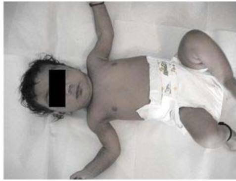
FIGURA 1 Lactante de 3 meses con diagnóstico de Síndrome Kartagener

En la exploración física el paciente se encontraba en estables condiciones generales, afebril, normohidratada con cianosis generalizada, signos vitales: -FC: 98 lat/min, -FR: 26 res/min -T/A: 110/70, T°: 37,5 °C. Cardiopulmonar: tórax normoelástico, normo expansible, ruidos cardíacos rítmicos auscultable en hemitórax derecho, ápex visible y palpable, ruidos respiratorios presentes, con roncus en ambos campos pulmonares Abdomen: blando, depresible, no doloroso a la palpación, ruidos hidroaéreos presentes. Miembros: móviles, simétricos, completos, eutróficos, Neurológico: activo, desarrollo psicomotor adecuado para la edad. En los exámenes complementarios Leucocitos: 8,2, Linfocitos: 72 %, Neutrófilos: 19 %, Hemoglobina: 12,8 gr/dL, ALT: 14 iU/L, AST: 68 iU/L, creatinina: 0.5 mg/dL, Glicemia: 50 mg/dL. La radiografía de tórax y el ECG muestra Situs Inversus Total, con imágenes aerolares y cordonaes en ambas bases, sugerentes de bronquiectasias. (Fig. 2 )