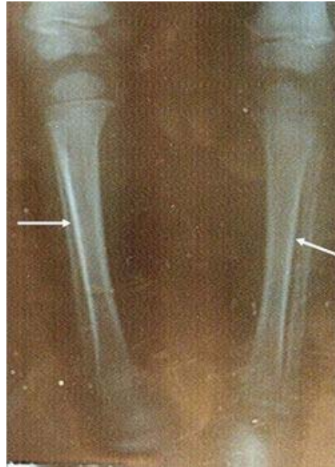
Figura 1. Radiografías de tibia y peroné. Las flechas indican opacidades lineales subperiósticas

Los hallazgos señalados conllevaron al diagnóstico de síndrome linfoproliferativo y se solicitó la valoración por Oncología Infantil. La lactante fue valorada por Oncología Infantil el 21 de marzo, realizándosele la hematología especial la cual reportó: leucocitos 30.000 x mm 3 , con 100% de linfoblastos, hemoglobina 8 gr. %, hematocrito 25%, plaquetas 155.000. Se llevó a cabo aspirado de médula ósea el 22 de marzo que demostró 100% de linfoblastos (Figura 2)