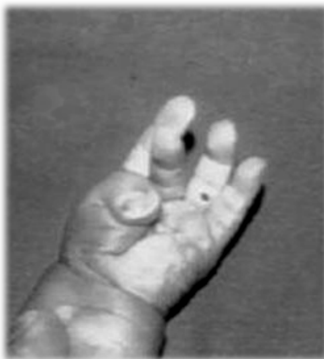
Figura 4. Evaluación física al nacer. Se aprecia clinodactilia axial del pulgar, con tendencia a la inclusión y movilidad sin limitación de los otros dedos.