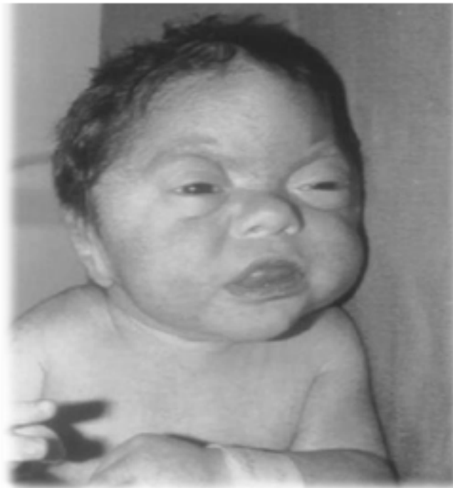
Figura 3. Evaluación física al nacer. Se aprecia cráneo irregular, oxicefálico, hipoplasia de estructuras óseas supraorbitarias y del terciomedio de la cara, pseudo exoftalmos y orejas de implantación baja.