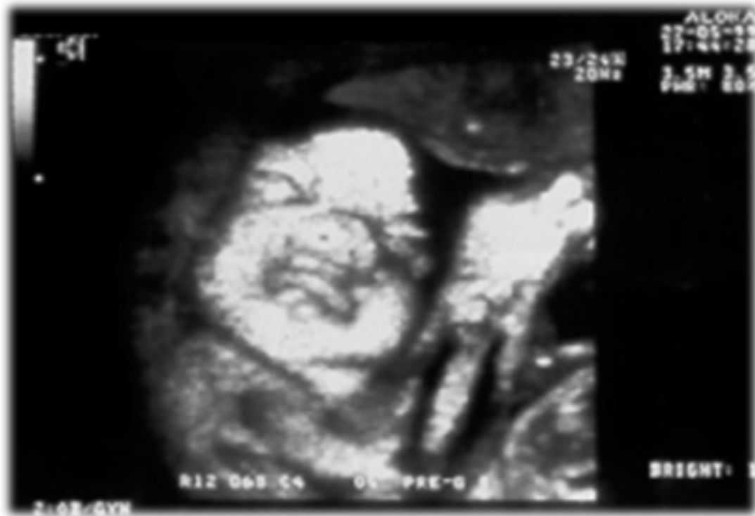
Figura 1. Imagen tridimensional en la cual se aprecia cebocefalia, craneoostenosis, hipoplasia del tercio medio de la cara, hipertelorismo y exoftalmos.