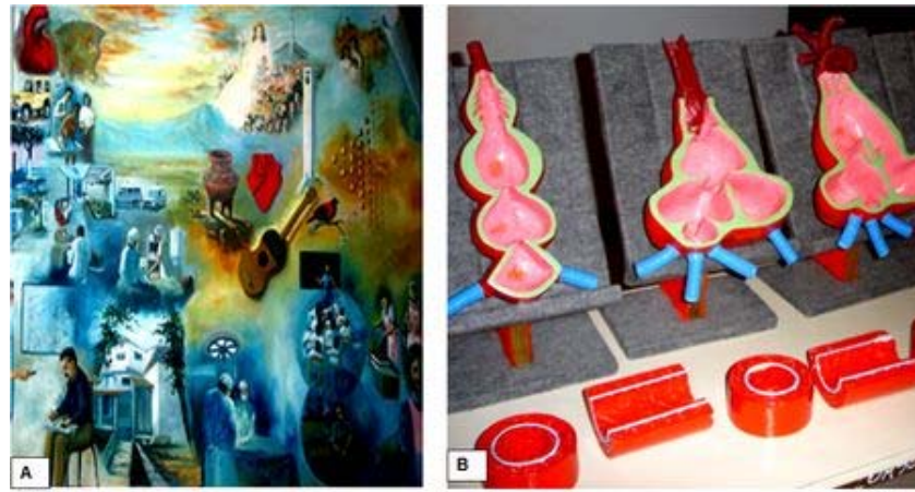
Figura 13. Museo del corazón. ASCARDIO Barquisimeto.

A. Mural del museo ( Disponible en Internet. Museo del corazón. ASCARDIO.)