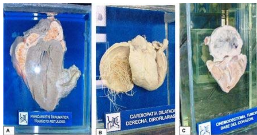
Figura 10. Piezas del museo "Gustavo Bracho" A. Pericarditis traumática con fistulización B. Cardiopatía dilatada. Dirofilariasis C. Quemodectoma de la base del corazón.