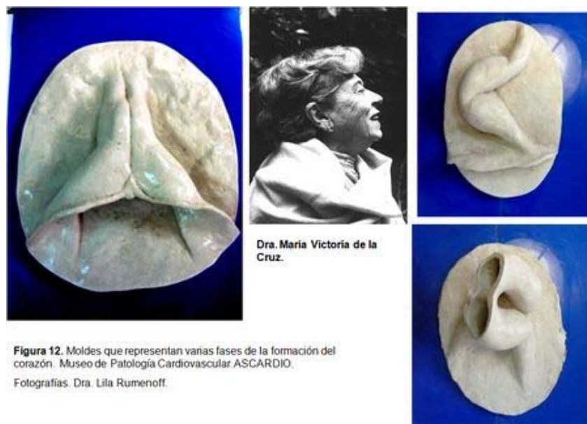
Figura 12. Moldes que representan varias fases de la formación del corazón. Museo de Patología Cardiovascular ASCARDIO.