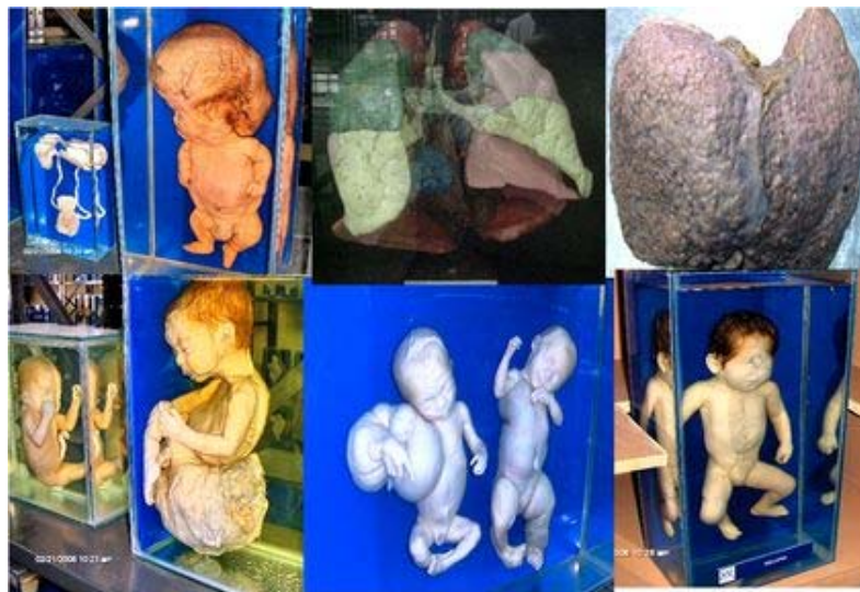
Figura 9. Varias piezas del museo "Gustavo Bracho". Con anomalías congénitas y enfermedades adquiridas.