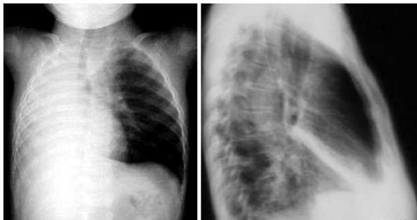
Figura 3. Atelectasias secundarias a broncoaspiración de cuerpo extraño en la vía aérea.

Por último se produce la obstrucción total del paso del aire cuyo resultado será la atelectasia del segmento o del pulmón afecto (Fig.3), seguida de bronconeumonía (muy grave cuando se trata de cuerpos extraños de material orgánico).