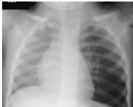
Figura 2. Radiografía en espiración. Evidente hiperlucencia unilateral en el pulmón izquierdo por efecto de válvula y desviación a la derecha del mediastino.

efectuará el examen físico de las vías respiratorias, en la auscultación encontraremos un murmullo vesicular rudo o sibilantes aislados, donde el segmento pulmonar con más incidencia es el del lóbulo inferior del pulmón derecho, esto se debe a que es el de mayor diámetro, el más recto en relación con la tráquea y por último el más declive; Esta etapa del cuerpo extraño bronquial coincide con la primera de las complicaciones, es decir cuando el objeto se comporta como una válvula de libre paso (7) . Poco después, en dependencia de factores como: la irritación que produzca el cuerpo extraño sobre la pared bronquial, y por su naturaleza irritante sobre dicha pared (poco irritantes los objetos plásticos y metálicos, y muy irritantes los objetos orgánicos) aparecerá el edema progresivo de la mucosa; inicialmente la válvula cambia a ser de tipo de paso en un solo sentido, y como durante la inspiración la pared bronquial se dilata fisiológicamente permitirá sólo la entrada del aire e impedirá su salida, el resultado será un enfisema localizado a un pulmón (aumento de la sonoridad pulmonar, disminución global del murmullo vesicular, con sibilantes aislados) y radiográficamente hiperventilación, descenso del hemidiafragma homolateral y separación de los espacios intercostales (Fig:2) (1,2) .