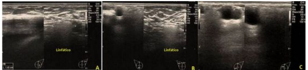
Figura 2. Ultrasonido Bilateral. Coexistencia de quistes complejos con nódulos hiperecogénicos homogéneos parcialmente delimitados con aspecto de nevada en todo el parénquima mamario con compromiso subcutáneo. Implantes mamarios retropectorales con dificultad para evaluación adecuada. Infiltración de músculos pectorales y linfático axilar bilateral con silicón.

Figura 1. Mamografía bilateral MLO (A) y CC (B). Glándulas medianas, simétricas con evidencia de múltiples opacidades nodulares densas dispersas de manera difusa en relación a granulomas de silicón con compromiso de músculo pectoral mayor de manera bilateral imposibilitando la evaluación del tejido mamario. Implantes mamarios difíciles de identificar, por su ubicación impresionan estar indemnes. No es posible realizar maniobra de Ecklund por poca movilidad de los implantes.