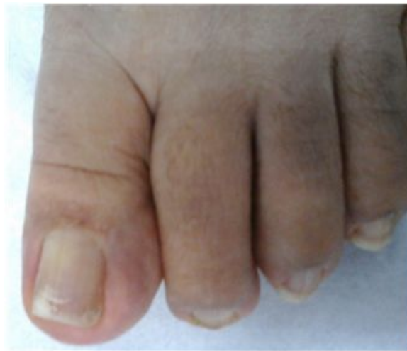
Figura 1: Uña con manchas blancas (semejando tizas), opacas, sobre la superficie de la lámina dorsal ungueal del dedo mayor del pie izquierdo.

Paciente femenina de 47 años de edad, procedente de un área rural de la República Dominicana y actualmente residente en la ciudad de Santo Domingo, con alteraciones de la uña del dedo mayor del pie izquierdo porción distal, de cinco años de evolución. Las lesiones que consistían en manchas blancas (semejando tizas), opacas, sobre la superficie de la lámina dorsal ungueal con ligero opacidad en la lámina ungueal (Figura 1), la cual había sido tratada con diferentes antifúngicos sin mejoría. La paciente no refirió antecedentes clínico-patológicos de importancia ni antecedentes de visitas recientes a zonas rurales.