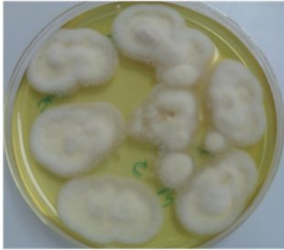
Figura 4: Segunda muestra subcultivada en Agar papa, 7 días de crecimiento, colonias crema-amarilla