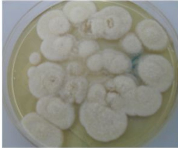
Figura 2: Colonias en SBC de 7 días de incubación a 28 °C.

Se inocularon por duplicado cajas de Petri conteniendo medio de Sabouraud cloranfenicol (SBC), con un mínimo de diez escamas procedentes de la muestra obtenida de la uña de la paciente. Todas las muestras así sembradas se incubaron a 28 °C y revisadas cada 48 horas en busca de crecimiento. Al 4to. día se observó el crecimiento de colonias ligeramente amarillo a crema pálido, hasta su madurez al 7° día con micelio granular ligeramente radiado y reverso amarillo pálido (Figura 2.)