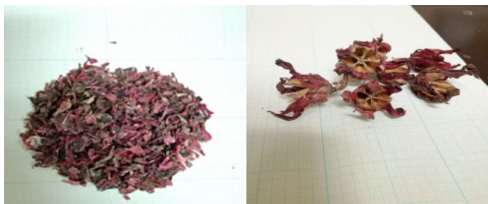
Figuras 1 y 2. Material vegetal empleado en el estudio (cálices de H. sabdariffa )

Los cálices de H. sabdariffa , fueron obtenidos de plantaciones propias por los investigadores, ubicada específicamente en el sector Coropo, Santa Rita del estado Aragua Venezuela Junio-Diciembre de 2019. Estos fueron deshidratados y almacenado libre de humedad, hasta su análisis en el Laboratorio de Metales Pesados y Solventes Orgánicos de la Universidad de Carabobo, sede Aragua (Figuras 1 y 2).