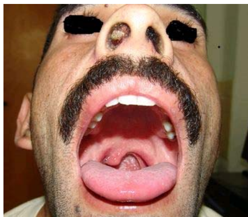
Fig. 1: Se observa lesión obstructiva por rinoscleroma a nivel de fosa nasal derecha.

Señaló haber sido tratado en varias ocasiones con antibióticos sistémicos que no precisa, sin mejoría aparente. Por indicación de médicos del área se realizaron exámenes paraclínicos previos, entre ellos un estudio histopatológico, el cual reportó : neuroblastoma olfatorio. Acude a nuestro servicio para valoración y conducta, momento en el cual se sospecha de rinoscleroma Al interrogatorio niega antecedentes familiares y personales de importancia. Dado que es procedente de un área endémica para Leishmaniasis Cutáneo Mucosa se decide realizar exámenes complementarios para descartar dicha patología, resultando estos negativos. Con la sospecha clínica de enfermedad por Klebsiella rhinoscleromatis , decidimos el siguiente plan de estudios diagnósticos: