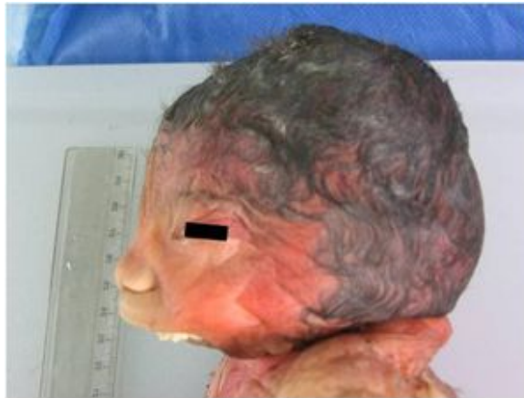
Figura2. Feto con agnatia, hipoplasia malar y pabellones auriculares en región cervical. (Vista lateral)

En la región perioral se aprecia labio inferior parcialmente formado con hendidura en región media, en la zona central del defecto se localiza la lengua hipoplásica (Figura 3).