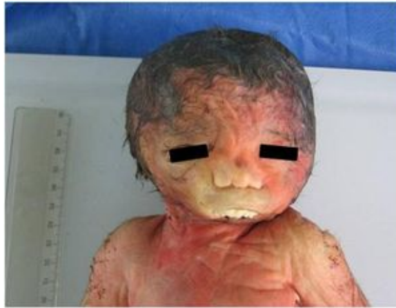
Figura 1. Feto con agnatia, hendiduras palpebrales largas, puente nasal ancho y filtrum liso. (Vista frontal)