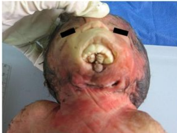
Figura 3. Feto con agnatia, paladar estrecho con persistencia de crestas palatinas secundarias, hipoplasia lingual, labio inferior parcialmente formado con hendidura medial, pabellones auriculares dismórficos, con rotación posterior y fusionados en región cervical.

En la región perioral se aprecia labio inferior parcialmente formado con hendidura en región media, en la zona central del defecto se localiza la lengua hipoplásica (Figura 3).